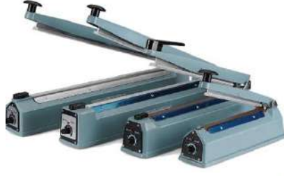
20-30-40-50 cm DEMİR GÖVDE POŞET YAPIŞTIRMA MAKİNA