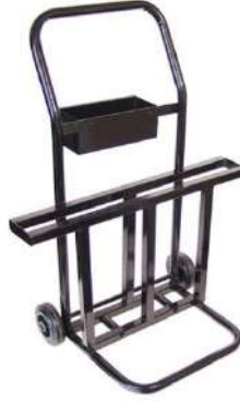
ÇELİK ÇEMBER ARABASI