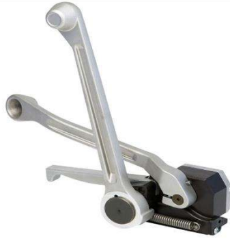
HP-TK-19 / 16-19 mmm KENETLEMELİ ÇELİK ÇEMBER MAKİNASI (Yeni tip)