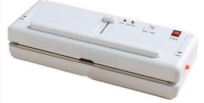
EV TİPİ WAKUM MAKİNASI