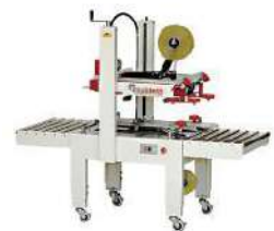
PT-FXJ-6050 Alt Üst Kayışlı