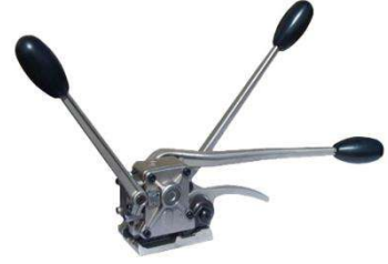
HP-S-32K / 32mm TOKASIZ ÇELİK ÇEMBER MAKİNASI