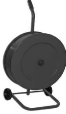
TEK KOLLU PET ARABA