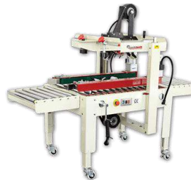
PT-FXJ-5050 Yan Kayışlı