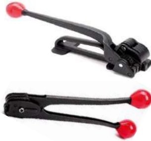
HP-16-19-G / HP-16ST / HP-19ST MANUEL ÇELİK ÇEMBER GERME TOKALAMA