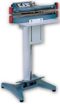
45-60-80 CM AYAKLI POŞET YAPIŞTIRMA MAKİNA