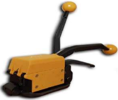
A-333 / 16-19mm TOKASIZ ÇELİK ÇEMBER MAKİNASI