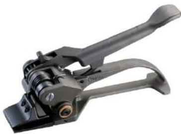
32mm MANUEL ÇELİK ÇEMBER GERME