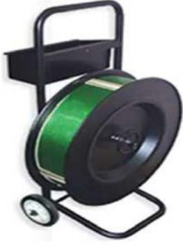
ÇİFT KOLLU FRENLİ ARABA