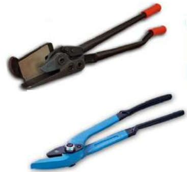
ÇELİK ÇEMBER KESME MAKASI