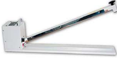
60-80-100 cm PROFESYONEL POŞET YAPIŞTIRMA MAKİNA