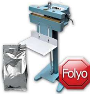
40 CM 10MM AYAKLI DEMİR ÇENE POŞET YAPIŞTIRMA MAKİNA