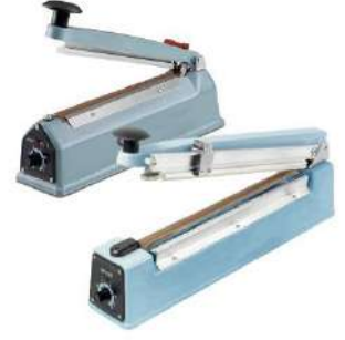
20-30-40-50 cm DEMİR GÖVDE KESMELİ POŞET YAPIŞTIRMA MAKİNA