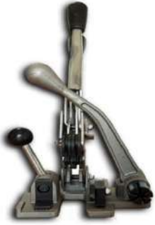
ERP-99 MANUEL ÇEMBER TOKALAMA MAKİNASI (HP12M)