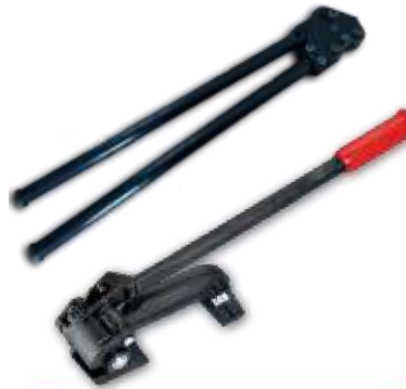
32MM - HP-32P / HP-32 G MANUEL ÇELİK ÇEMBER GERME TOKALAMA