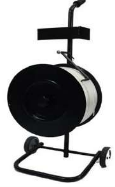
TEK KOLLU KOMPOZİT ARABASI