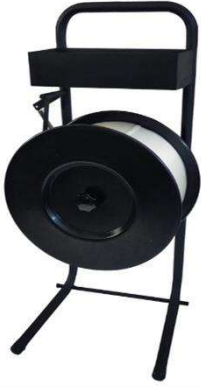
ÇİFT KOLLU KOMPOZİT ARABA