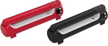
20 cm EV TİPİ POŞET YAPIŞTIRMA MAKİNA