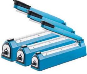
20-30-40 cm PLASTİK GÖVDE POŞET YAPIŞTIRMA MAKİNA